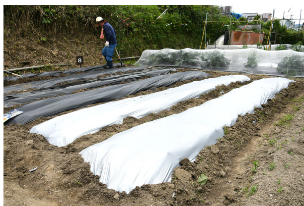
NINJA マルチシリーズを使用した畑