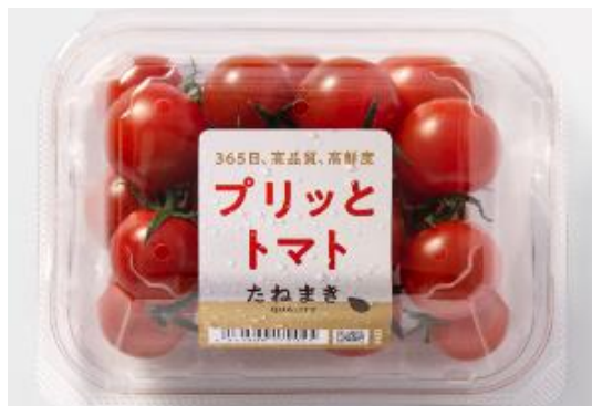
自社ブランド「たねまき QUALITY」ブリットトマト