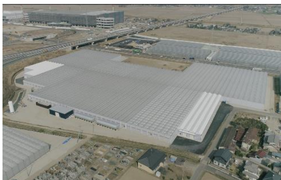
施設全景（施設面積約5ha）

たねまきでは、雇用機会の創出にも取り組んでいます。今回の大規模な農場の稼働に伴い、たねまき常総農場での180人規模の採用を実現し、地域雇用にも貢献しています。今後は、今回完工した農場の他にも日本各地への拠点の設立や、栽培品目の拡大も予定しており、持続可能な農業の創出ならびに地域活性化に貢献する取り組みを進めていきます。