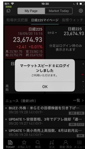
認証完了で「MARKET SPEED II」にログイン