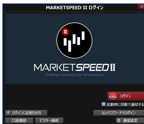
① 「ログイン」のボタンをクリック