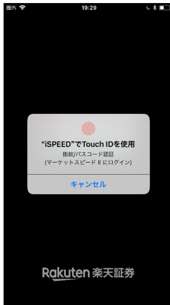
④ 指紋または顔、パスワードで認証