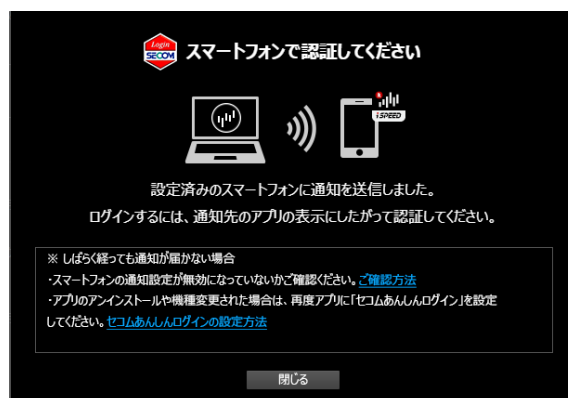
②初期設定で連携したスマホアプリ「iSPEED」に通知が送信