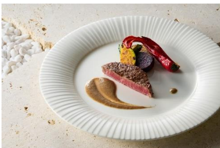
沖縄県産黒毛和牛の炭火焼き