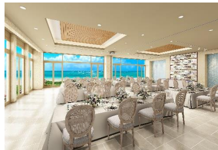
シーサイドテラス 1F

フラワーウォール、ウォールアート、ガゼボなど、たくさんのフォトスポットをご用意。