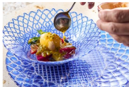
沖縄フルーツのマチェドニア