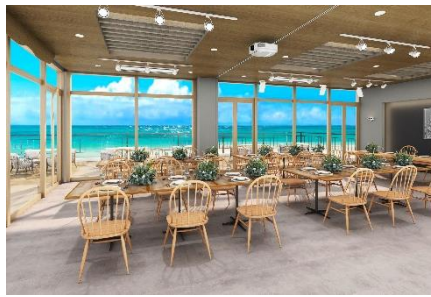
シーサイドテラス 2F