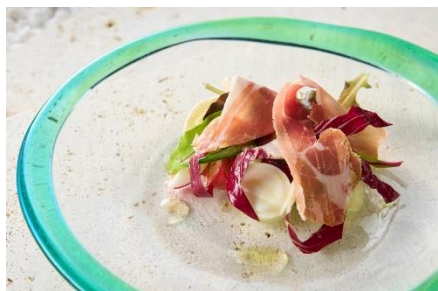
水牛のモッツアレラと島野菜のサラダ