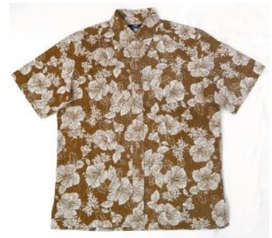
<SHIPS オリジナル ボタン ダウンショートスリーブシャツ>