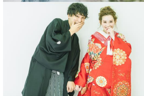
<フォトスタジオ撮影イメージ>