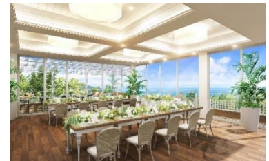
※完成予定イメージ