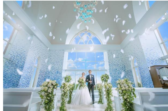
<フェザーシャワー>