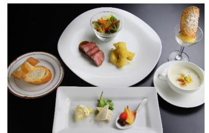
< 西洋料理 >