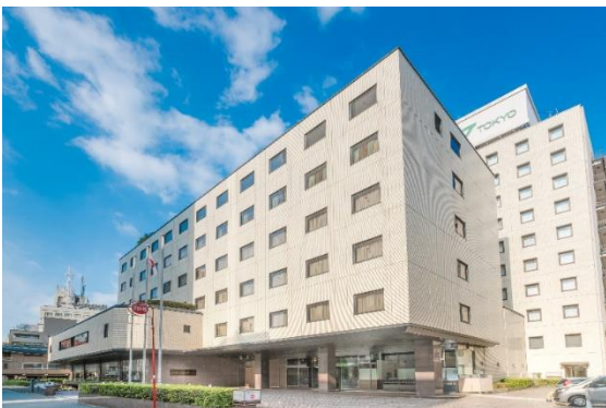
<ホテル メルパルク東京>

メルパルクは、今後も地域コミュニティーに愛されるお客さま満足度No.1ホテルを目指し、各種イベントやお得なキャンペーンなどを実施してまいります。