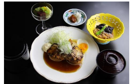
< 日本料理 >