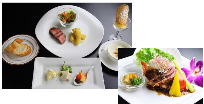
<“生姜”にこだわった特別メニュー>