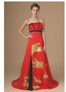
※着物ドレスイメージ

■特設Webサイト： http://www.watabe-wedding.co.jp/dogweddingphoto/