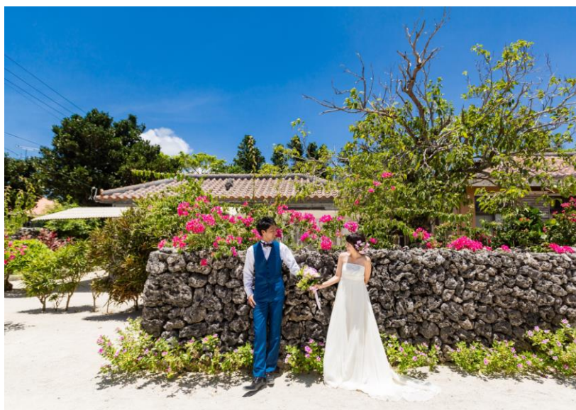
<竹富島フォトツアーイメージ>