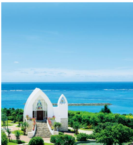
<クルデスール・チャペル外観>

今後も当社では、リゾートウェディングのリーディングカンパニーとして、60万組を超えるお客様の幸せな場面に立ち会ってきた経験と新しい価値の提案で、お客様の想いに応えられるようなウェディングスタイルを提案してまいります。