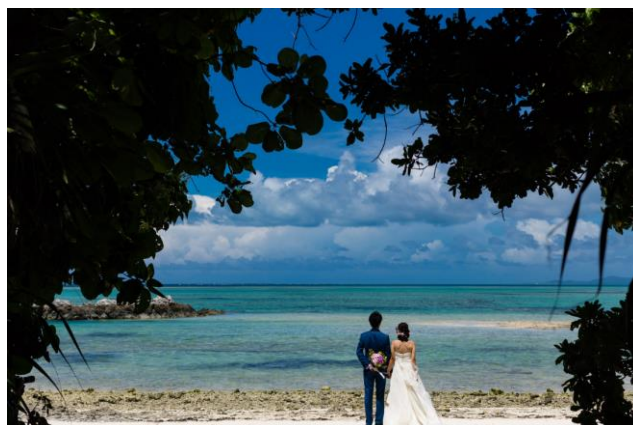
<竹富島フォトツアーイメージ>