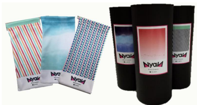
■マイクロファイバー製巾着、紙筒ケース

■URL : https://www.vision-megane.co.jp/brand/nyan/