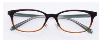
ブラックブラウン