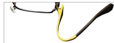
曲げに強く壊れにくい「ウルテム」