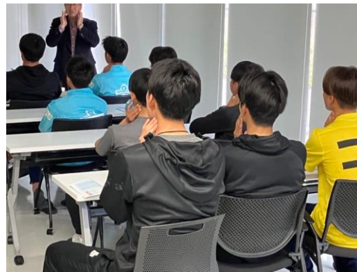
口腔健康セミナーを受講するジュビロ磐田アカデミー生