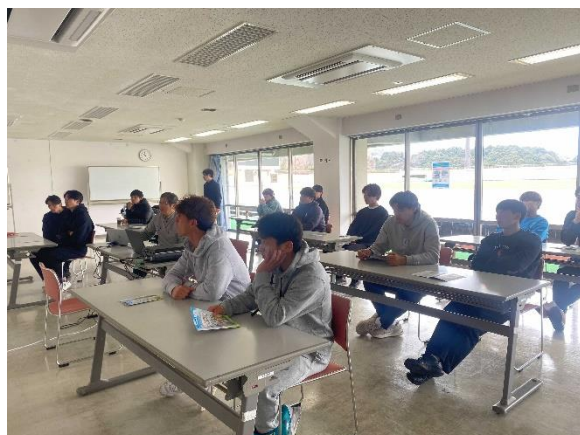
口腔健康セミナーを受ける選手