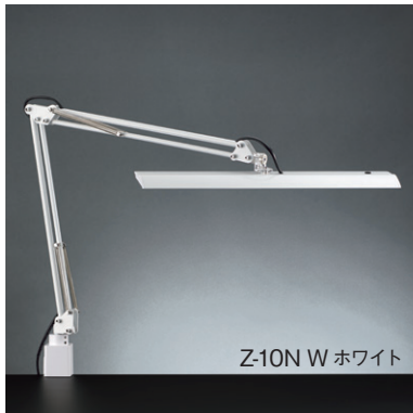
Z-10N W ホワイト