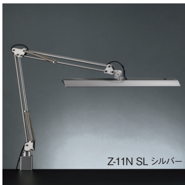
Z-11N SL シルバー

光源：LED 11.9W [白熱灯150W相当] 色温度固定型 (5000K) Ra80 中心直下照度：2,430 lx 材質：アルミ、樹脂、銅 重量：1.4kg