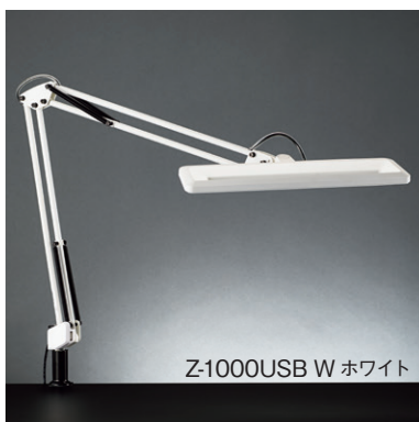
Z-1000USB W ホワイト

光源：LED 11.9W [白熱灯150W相当] 色温度固定型 (4000K) Ra80 中心直下照度：2,187 lx 材質：アルミ、樹脂、銅 重量：1.4kg