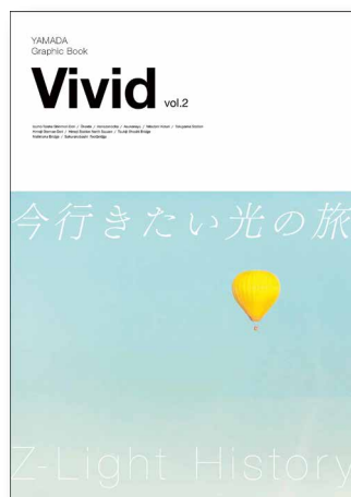
Yamada Graphic Book 「Vivid vol.2」 (A4版 32ページ)

山田照明は、今後もクォリティの高いオリジナル照明のご提案を進めてまいります。何卒ご指導ご鞭撻を賜りますようお願い申し上げます。