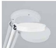
軽い力で向きを変えられる薄型ヘッド