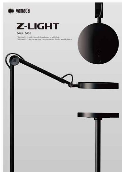
Z Light 2019-2020 (A4版 24ページ)

伝統を継承し、さらに使いやすさを追求する Z ライト、並びに山田照明にさらなるご支援を賜りますようお願い申し上げます。