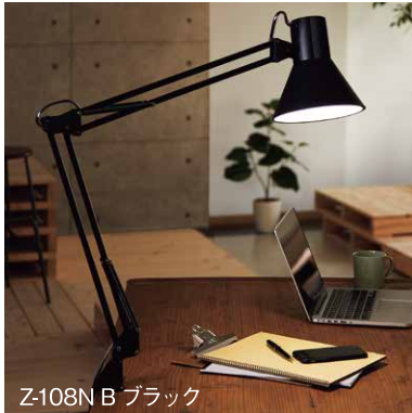
Z-108N B ブラック