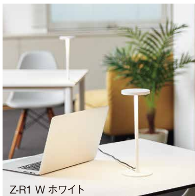
Z-R1 W ホワイト