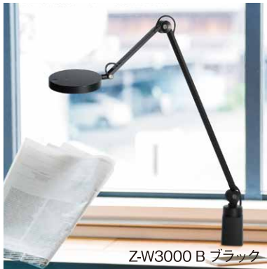
Z-W3000 B ブラック