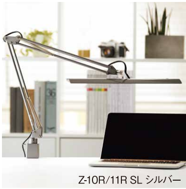
Z-10R/11R SL シルバー