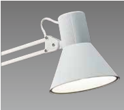
Z-108N W ホワイト