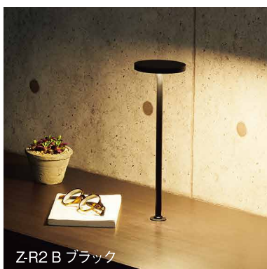
Z-R2 B ブラック

光源：LED 7.6W [白熱 60W相当] 4000K Ra90 中心直下照度：2933 lx (30cm 高) 材質：鋼、アルミ、樹脂 重量：0.8kg