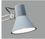
Z-108N GY グレー