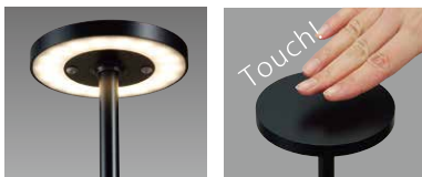
Z-R1 B ブラック