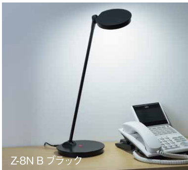
Z-8N B ブラック