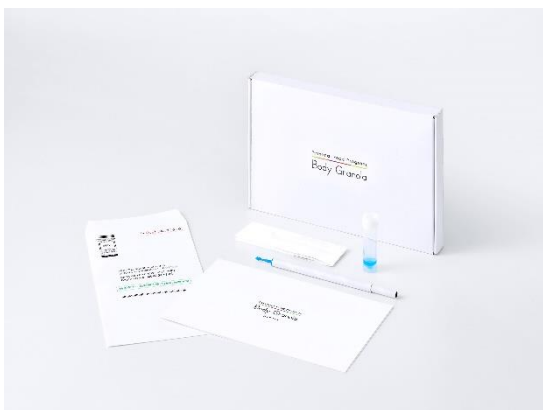
<腸内フローラ検査キット>