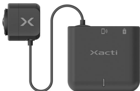
ウェアラブルライブ映像デバイス「CX-WL100」