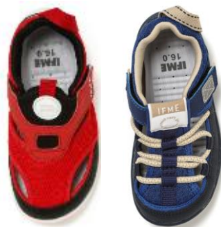
つま先を覆う設計