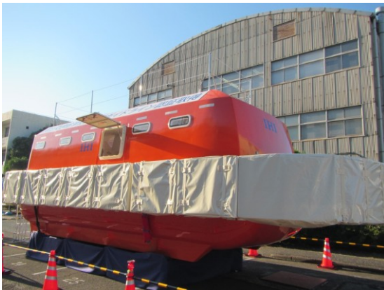
モデルチェンジ型津波救命艇

タカタでは、今回の津波救命艇専用シートベルトの開発等を通して、あらゆる安全分野において貢献できるよう取り組んでまいります。