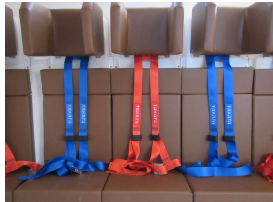
救命艇専用 4 点式シートベルト

※1津波救命艇 2011年3月11日に発生した「東北地方太平洋沖地震」では、地震に加え巨大な津波が発生し、東北地方の太平洋岸を中心に甚大な被害をもたらしました。日本では、今後数十年以内に大型の地震が発生することが予想されています。津波から身を守る手段としては、高台などの高所への迅速な避難が基本ですが、速やかな避難が困難なケースも想定され、国土交通省では、船舶用救命艇の技術を活用した「津波救命艇」を考案し、機能要件等をガイドラインとして取りまとめました。