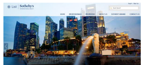
新設ホームページ