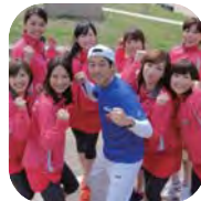
森脇健児 陸上競技部 女子部(選抜)

「森脇健児陸上競技部」代表者。TBS「オールスター感謝祭」のミニマラソンにおいてはハンデがありながらも常に上位の成績を収める。月間250km超のトレーニングや大会への参加等、タレント活動と並行してアスリートとしても活動している。