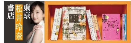
店頭配布しおりイメージ

「#木曜日は本曜日」公式 Twitter : https://twitter.com/honyoubi