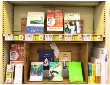
第一弾店舗設置の様子