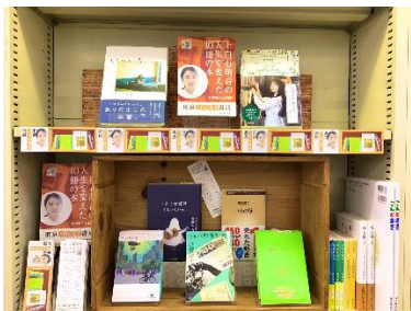
第一弾店舗設置の様子