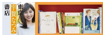
店頭配布しおりイメージ

「#木曜日は本曜日」特設棚設置・販売店舗： https://honyoubi.com/assets/data/present_shoplist.pdf