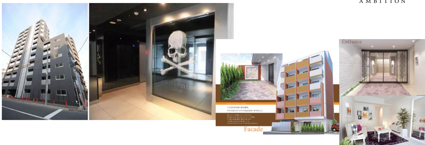
※上記写真は、ヴェリタスの開発実績のある物件です。