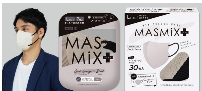
クールグレー×ブラック

クールグレーとサンドベージュの2色展開で、それぞれ7枚入と30枚入で発売いたします。