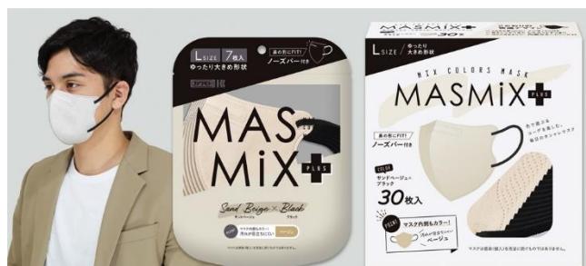
サンドベージュ×ブラック