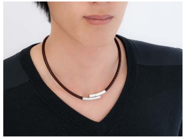
※着用イメージ (Lサイズ)