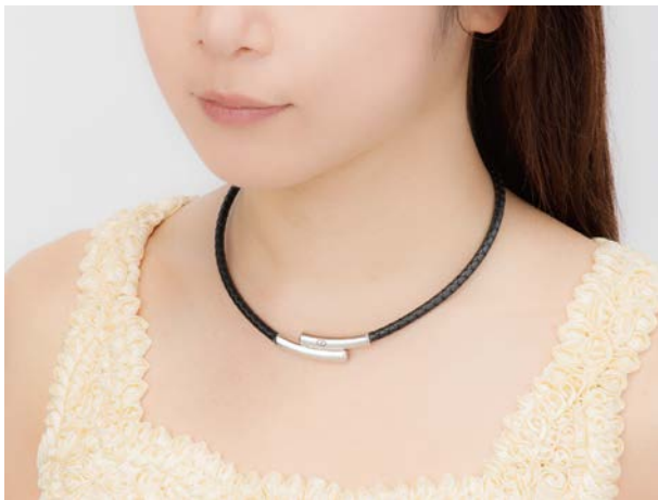
※着用イメージ (Mサイズ)

フロントジョイントは着脱がしやすい形状になっています。コラントツテこだわりの耐蝕性の高いステンレス採用で、一点一点丹念な手磨き加工を施し、ラグジュアリーな輝きを放っています。