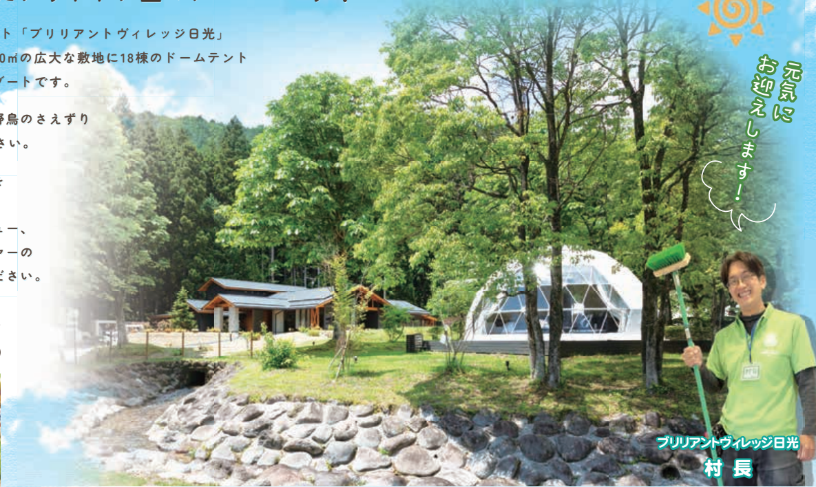
プリリアントヴィレッジ日光 村長