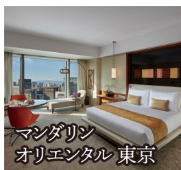
マンダリン オリエンタル 東京