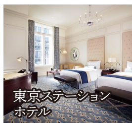
東京ステーション ホテル