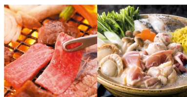
グルメカタログギフト