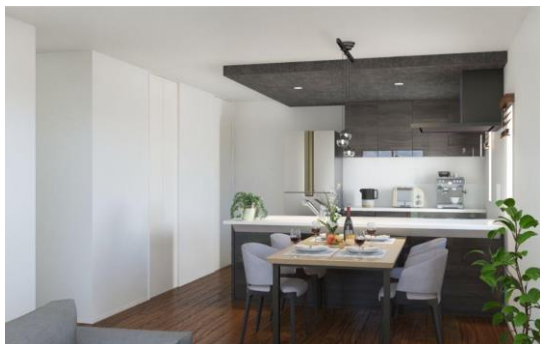
フルハイトドア・ペニンシュラキッチン