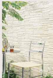
外壁 (15mmサイディング)