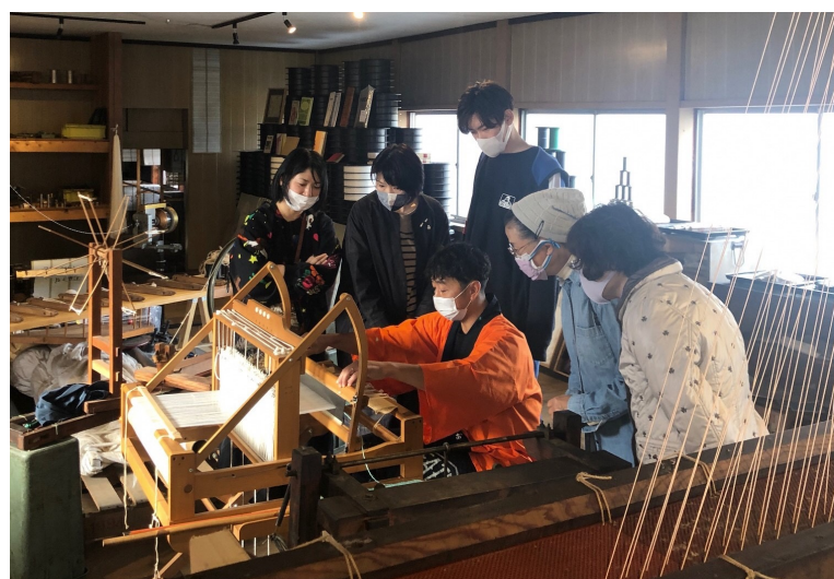
場所：オリジナークロスジャカード