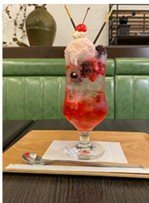
ベリーソーダフロート 900円（税込）