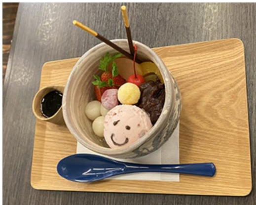
苺クリームあんみつ 950円（税込）

メインビジュアルに使用されている「拳の舞妓」をはじめ、本展には様々な“赤”が使われた作品がいくつもあります。前田珈琲のコラボメニューでは、明治・大正・昭和の様々な“赤”から着想を得て、夏らしいメニューが登場！