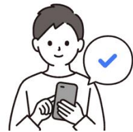
3. 決済の実行と確認