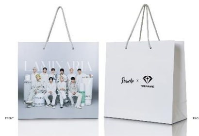
▲ShionLe x TREASUREショッピングバッグ イメージ