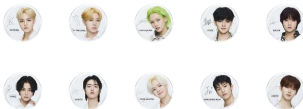
▲TREASUREオリジナルミラー イメージ