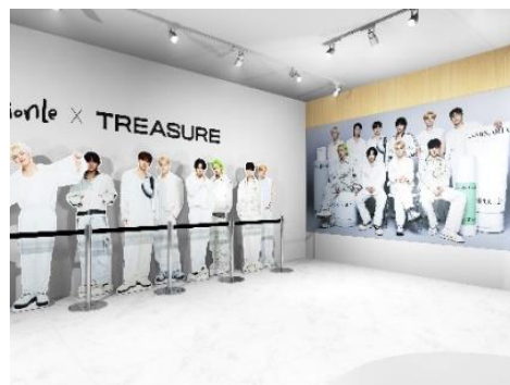
▲TREASURE等身大パネル イメージ