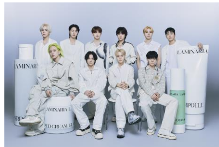
▲展示衣装イメージ