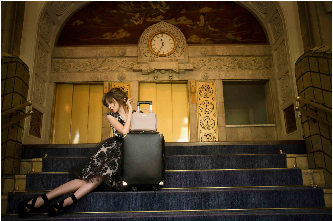
『Jewelna Rose』 プロモーション用ビジュアル