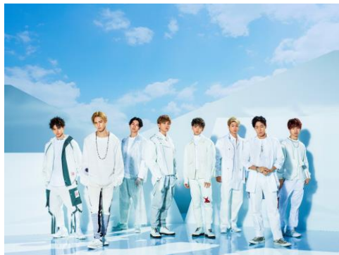
FANTASTICS from EXILE TRIBE