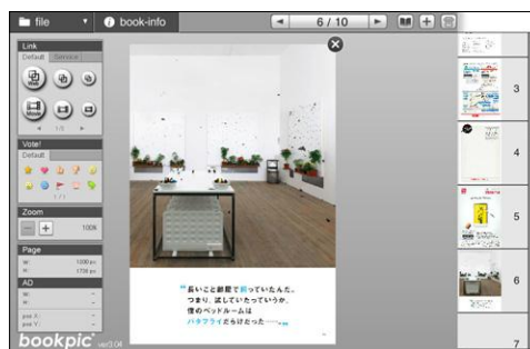
bookpic Editor 画面イメージ