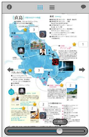
スマートフォン用ビューア 画面イメージ