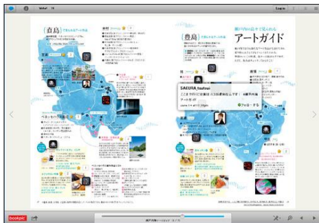
ビューア 画面イメージ