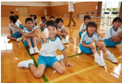
ラブレ菌を含む乳酸菌飲料の飲用