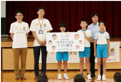
『みんなが行きたくなるトイレ』贈呈式