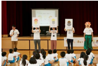
『おなかを元気にする授業』