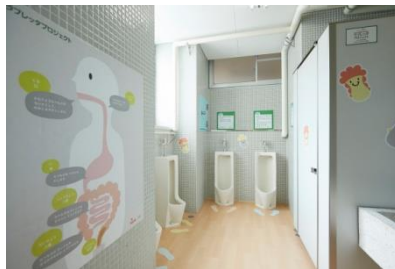
トイレ空間改善後①