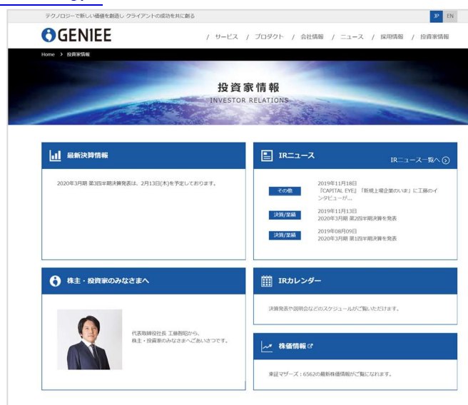
投資家情報ページ