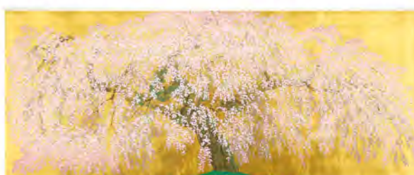
中島千波/光善寺の枝垂れ桜