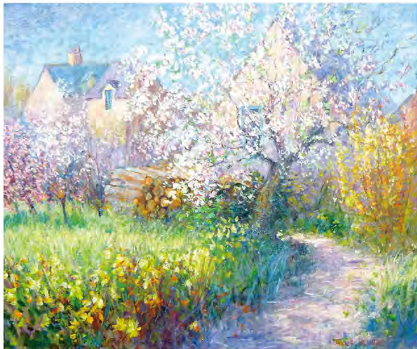
ジャネット・ルール「庭の小道 4月のエルサンラメー村」(油彩 10F 相当 45x53cm)