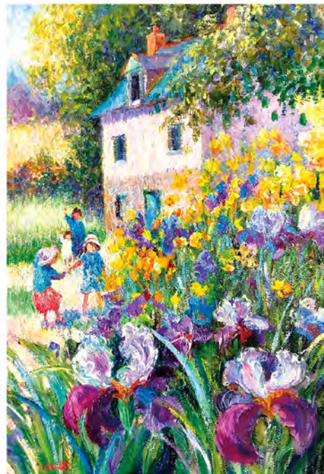
ジャネット・ルール「また会いましょう」(油彩 5P)