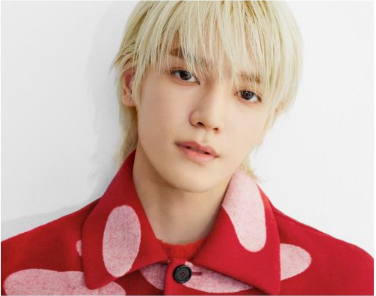
LOEWE Global Brand Ambassador TAEYONG