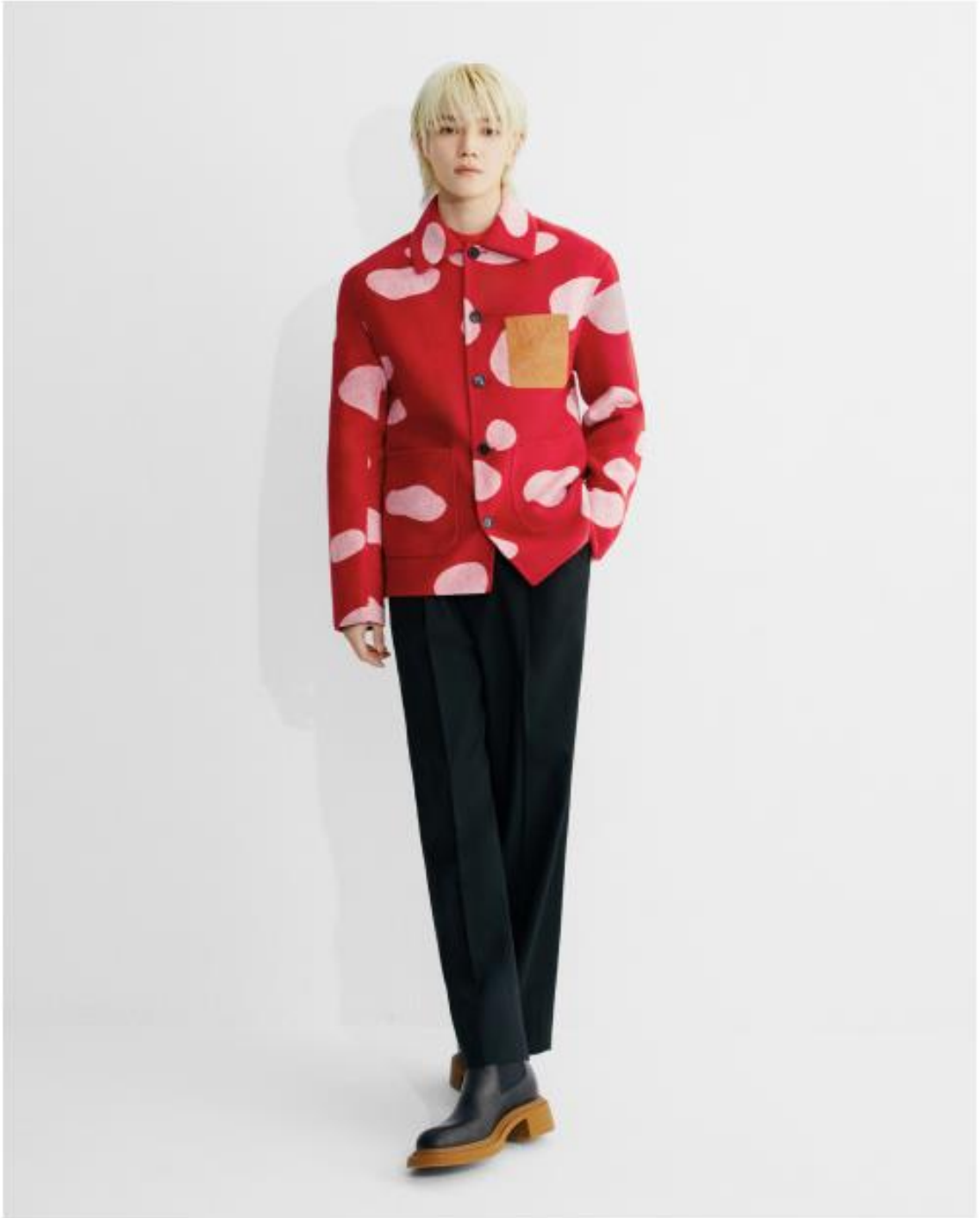
LOEWE Global Brand Ambassador TAEYONG