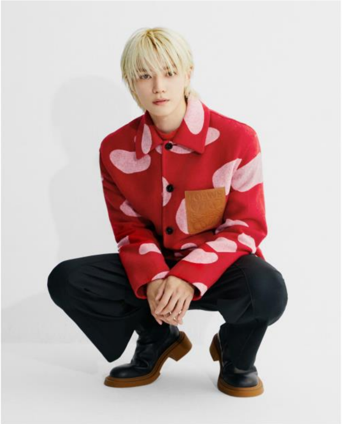
LOEWE Global Brand Ambassador TAEYONG