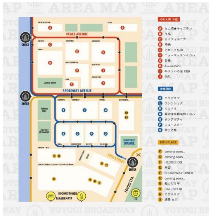
代々木ブロードウェイ MAP