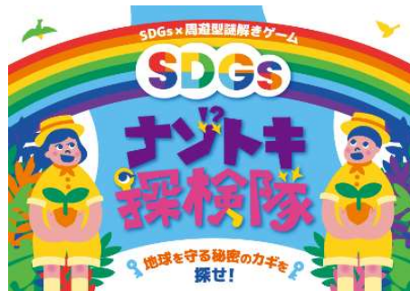
▲謎解きイベントイメージ