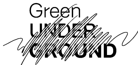
▲「Green UNDER GROUND」ロゴ

公式Instagram: https://www.instagram.com/gug_5stations?igsh=ZWNlbWl3dmE2czRo