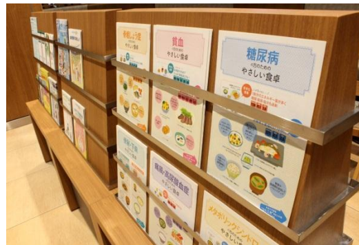
健康に関するパンフレットの専用ラック