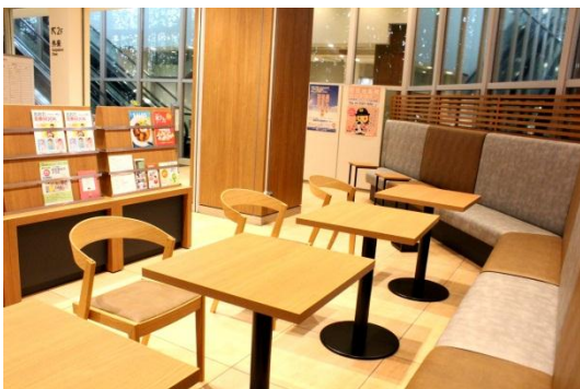
ラウンジスペース