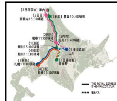
「HOKKAIDO 日本最北端の旅」のルート