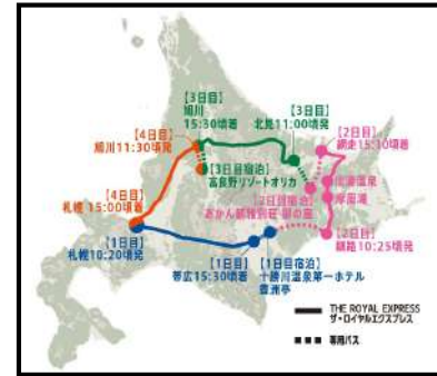
「HOKKAIDO CRUISE TRAIN」のルート