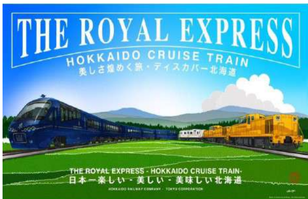
▲列車デザインイメージ©ドーンデザイン研究所

列車の動力となる機関車(JR北海道所有)は「北海道の力強く明るく元気な太陽の色・収穫の色」として「橙・オレンジ」を、列車内サービス用電力を供給する電源車(東急電鉄株式会社所有)は「『THE ROYAL EXPRESS』のロイヤルブルーとオレンジを粹につなぐ色」として「白・ホワイト」をメインカラーとし、北海道の自然豊かな緑の中を走る「THE ROYAL EXPRESS」のロイヤルブルーに橙、白が融合し、旅を楽しく美しく演出します。本列車の装飾は、「THE ROYAL EXPRESS」を手掛けた水戸岡鋭治氏がデザインしています。