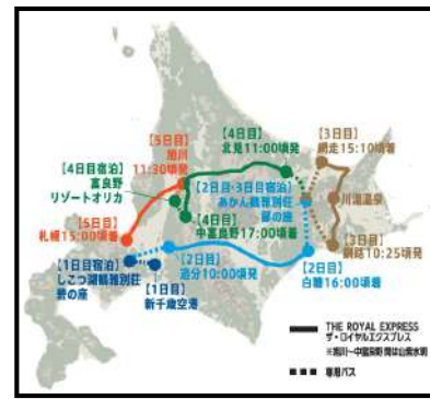
「HOKKAIDO 5th ANNIVERSARY CRUISE」のルート