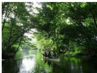
(中)釧路川源流カヌー