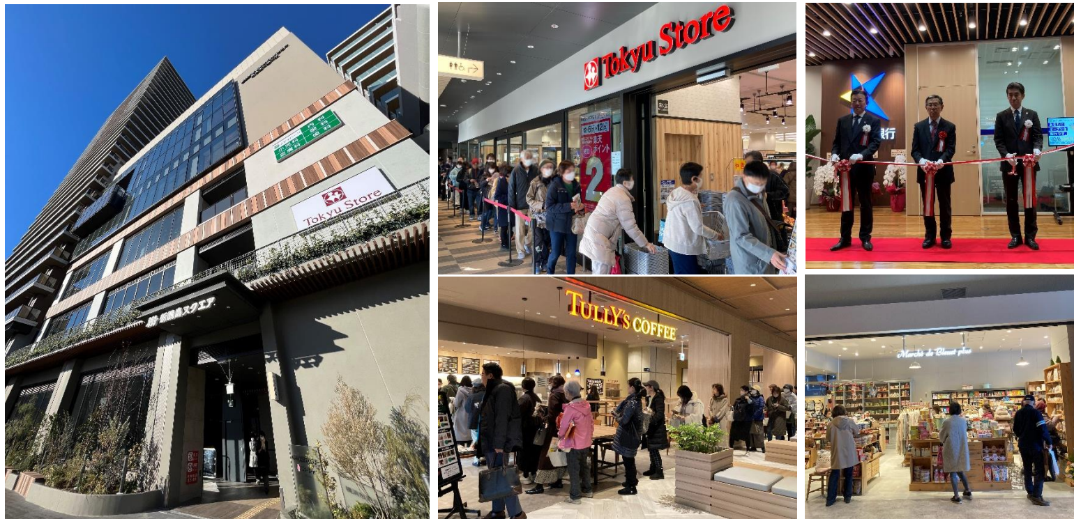
▲本日オープン後の商業施設部分の様子

新綱島駅前地区市街地再開発組合とその参加組合員である東急株式会社が、東急新横浜線「新綱島駅前地区」において開発する駅直結の複合再開発建物「新綱島スクエア(以下:本建物)」の商業施設部分が本日2023年12月6日より順次オープンしました。商業施設部分の1～2階の店舗(調剤薬局を除く)は本日開業、2階の調剤薬局と3階「メディパーク新綱島」は2024年1月より順次開業予定です。また、4～5階の横浜市港北区民文化センター「ミズキーホール」は2024年3月24日(日)に開館を予定しています。