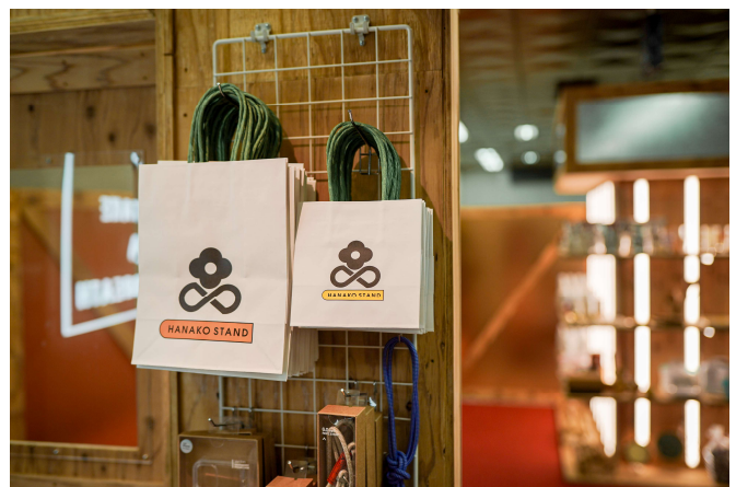
「Hanako Stand Shibuya」店舗