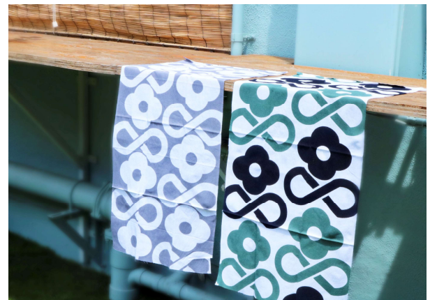
「Hanako Stand Shibuya」オープン記念商品