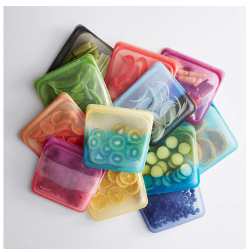
スタッシャーシリコンバッグ EZ サンドイッチ

https://online.euglena.jp/shop/necco/index.aspx