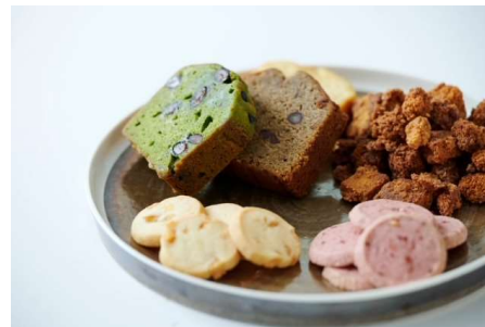
代官山青果店 焼き菓子

専属のパティシエが作る、身体に優しいクッキーやパウンドケーキが大人気で、渋谷店のオープンを機にコラボレーションしたスペシャリティーな焼き菓子を販売する予定です。 https://daikanyamaseikaten.jp/